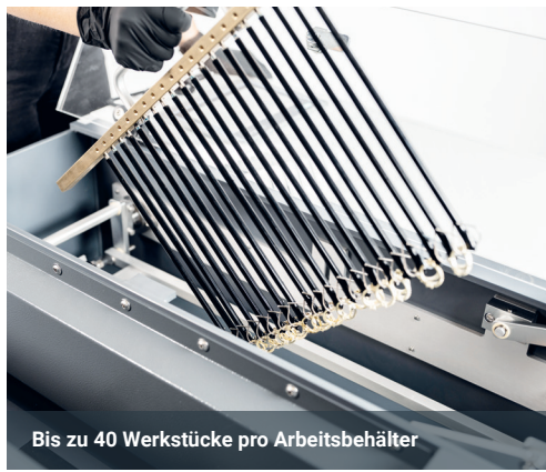
Bis zu 40 Werkstücke pro Arbeitsbehälter