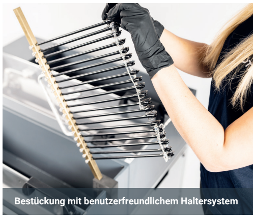
Bestückung mit benutzerfreundlichem Haltersystem