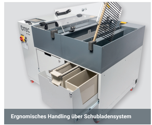
Ergonomisches Handling über Schubladensystem

Die anspruchsvolle Bearbeitung von filigranem Schmuck mit komplexen Geometrien erfordert ein besonders schonendes Glätten und Polieren. Mit der EF-Flex wird eine neue Dimension von strahlendem Glanz auch bei mit Steinen besetzten Schmuckstücken erreicht. Manuelle Tätigkeiten werden auf ein Minimum reduziert. Absolute Prozesssicherheit, die Bearbeitung bis in kleinste Winkel und extrem kurze Prozesszeiten ermöglichen eine große Wirtschaftlichkeit und hohe Stückzahlen.