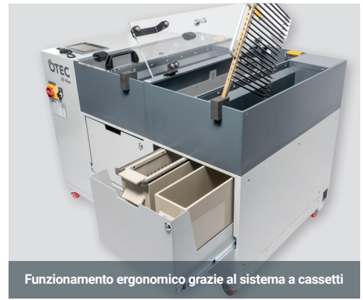
Funzionamento ergonomico grazie al sistema a cassette

La difficile lavorazione di gioielli in filigrana con geometrie complesse richiede un processo di levigatura e lucidatura particolarmente delicato. EF-Flex consente di ottenere una nuova dimensione di brillantezza elevata anche nei gioielli con pietre. Le attività manuali vengono ridotte al minimo. Sicurezza di processo assoluta, lavorazione fin nei minimi dettagli e tempi di processo estremamente brevi consentono un'ottima redditività e una produzione di pezzi elevata.