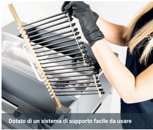
Dotato di un sistema di supporto facile da usare