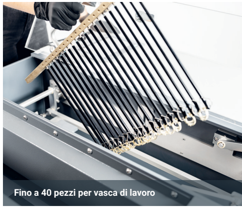
Fino a 40 pezzi per vasca di lavoro