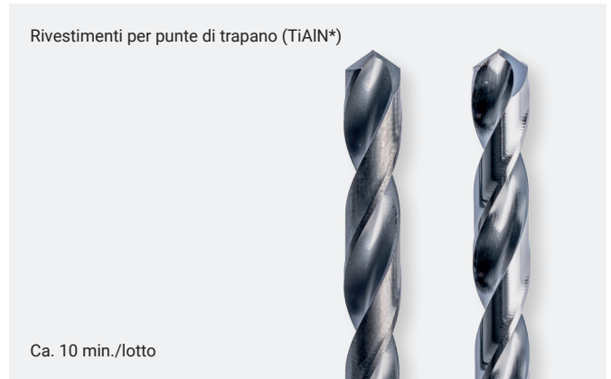
Ca. 10 min./lotto