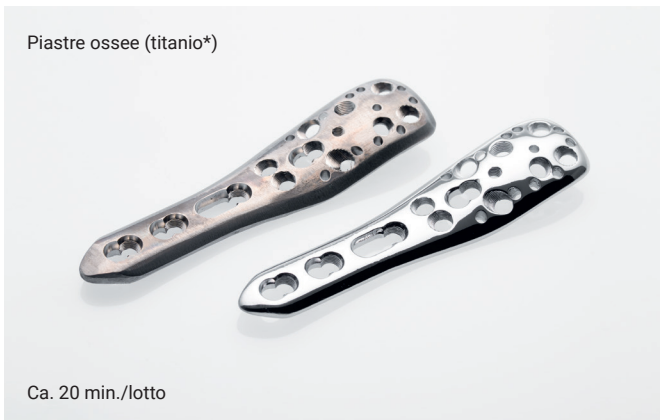
Ca. 20 min./lotto