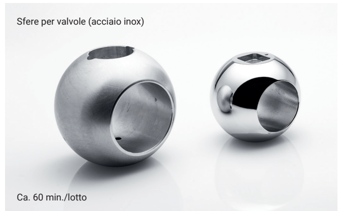
Ca. 60 min./lotto

* Lavorazione in EF-Performance con allestimento speciale