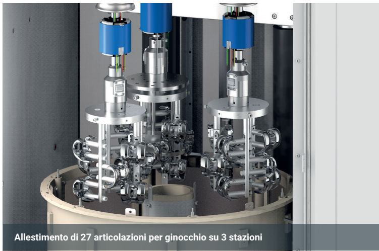
Allestimento di 27 articolazioni per ginocchio su 3 stazioni