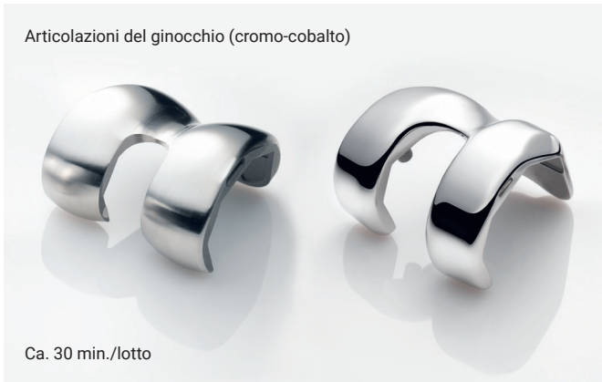
Ca. 30 min./lotto