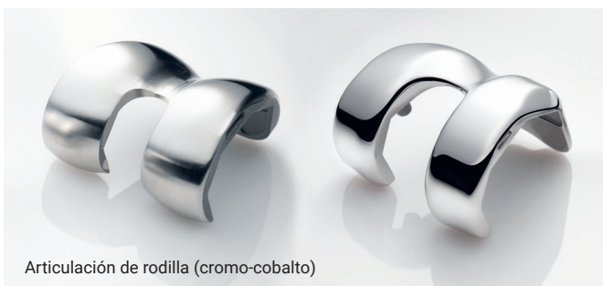
Articulación de rodilla (cromo-cobalto)