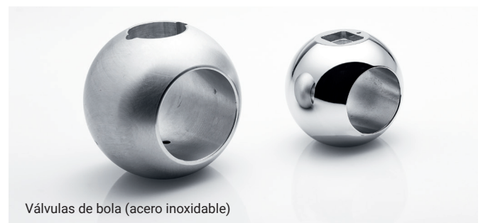
Válvulas de bola (acero inoxidable)

Descubra de primera mano los resultados de alto brillo de OTEC. En nuestro centro de acabado desarrollamos soluciones personalizadas que se adaptan a sus necesidades.