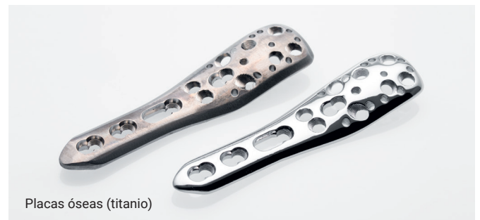
Placas óseas (titanio)