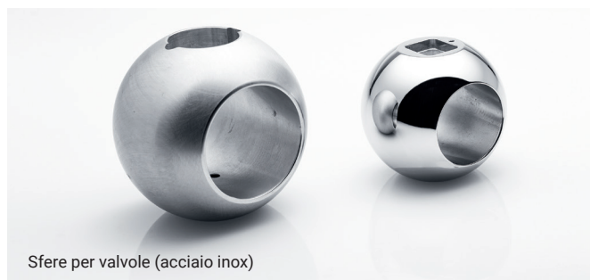
Sfere per valvole (acciaio inox)

Toccate con mano i risultati ad alta brillantezza di OTEC.