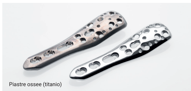
Piastrer ossee (titanio)