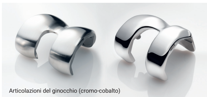
Articolazioni del ginocchio (cromo-cobalto)