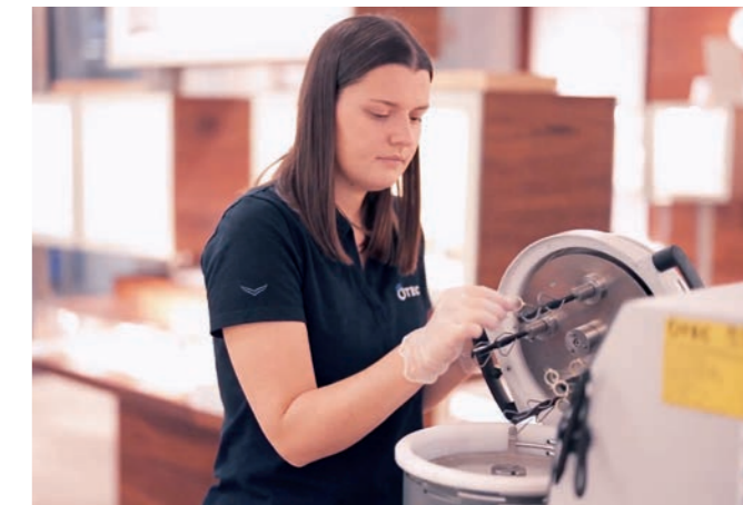
Die Schmuckstücke werden in die Halter eingehängt