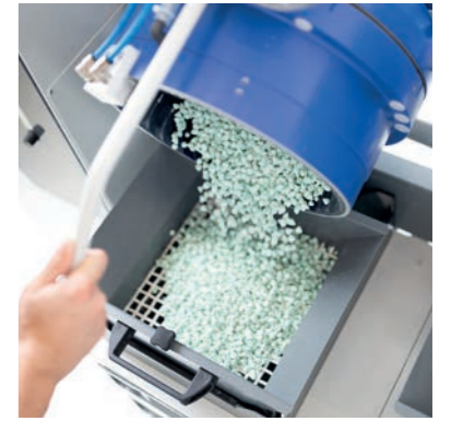
Einfaches Entleeren des Behälters