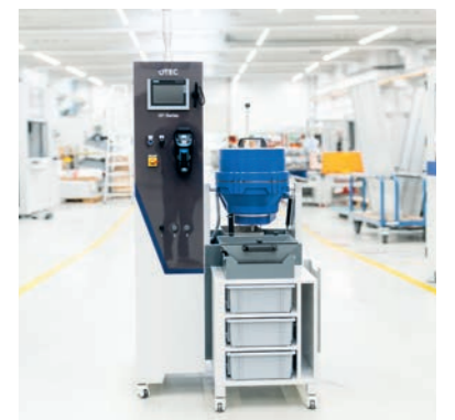
CF-Standard mit einem Behälter