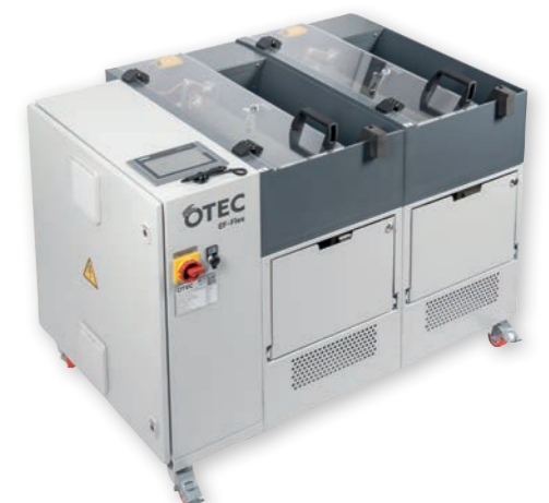
Von links nach rechts: EF-Smart S | EF-Compact | EF-Flex