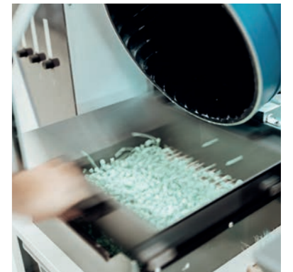
Zuverlässige Separation der Teile