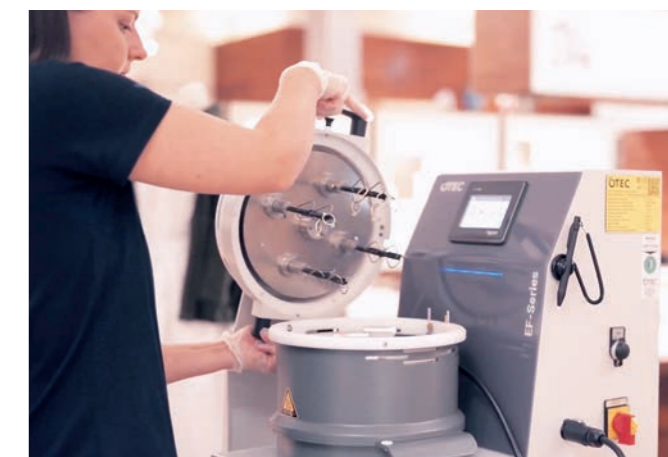
Der Deckel wird anschließend auf dem Behälter fixiert