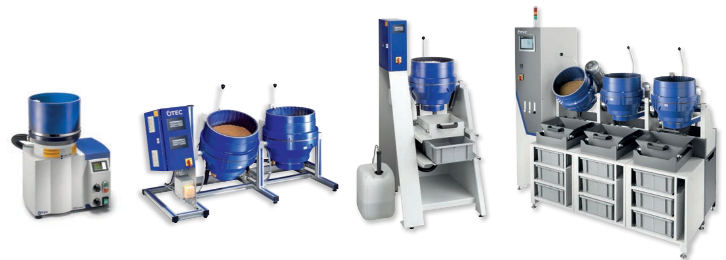
Von links nach rechts: Eco-Maxi | CF-T | CF-Element | CF-Standard

Vorteil: Verhindert ein Verkleben und Blockieren des Tellers und gewährleistet damit eine hohe Prozesssicherheit und einen geringen Wartungsaufwand. Dieses System ist optimal für Werkstücke ab einer Dicke von 0,7 mm.