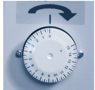
Die Zeitschaltuhr mit Anzeige in Stunden dient gleichzeitig als Start/Stopp Funktion

Tipp: Beginnen Sie beim Bearbeiten mehrerer Werkstücke immer mit wenigen Teilen. Dadurch bekommen Sie Erfahrung im Umgang mit größeren Mengen. Überladen Sie die Maschine nicht mit zu vielen Teilen, sonst besteht die Gefahr, dass diese sich in der Maschine gegenseitig beschädigen.