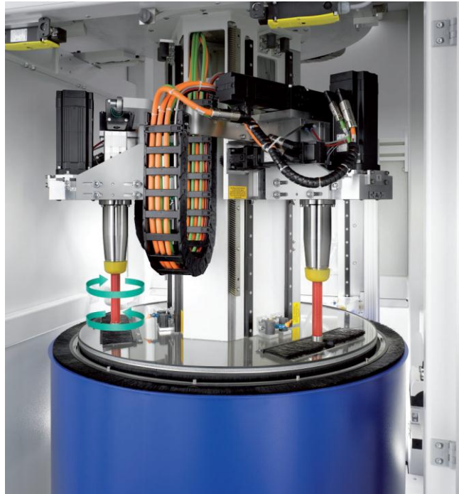
Die oszillierende Spindel wird in einer Sekunde auf 2.000/Min. beschleunigt und abgebremst

2.000/Min. beschleunigt, abgebremst usw. Zusätzlich ist die Spindel bis zu 25 Grad schwenkbar, sodass die Anströmung des Schleifmittels an das Werkstück an dessen Geometrie angepasst werden kann. „Die Bearbeitungszeit für eine Verringerung der Rautiefe von beispielsweise 0,2 µm auf 0,1 µm liegt bei unter einer Minute“, erläutert OTEC-Geschäftsführer Helmut Gegenheimer die Stärken des Maschinenkonzepts. Die Taktzeit beträgt je nach Anzahl der Spindeln 20 bis 25 Sekunden.